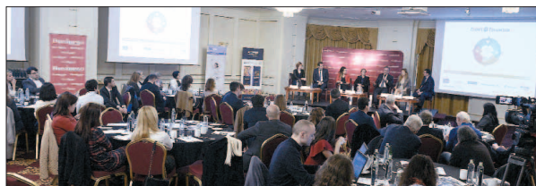
La conferința „Industria Asigurărilor, la un nou start” au participat 150 de profesioniști din asigurări

S chimbările legislative tot mai frecvente și tot mai îndepărtate de modelul unui cadru competitiv ca în Vest nu fac altceva decât să pună frână dezvoltării pieței locale de asigurări, în condițiile în care atât asigurătorii, cât și brokerii sunt mai preocupați acum să dezlege itele legislative decât să-și salte businessurile, aceasta a fost una dintre concluziile conferinței „Industria Asigurărilor, la un nou start”, organizată ieri de Ziarul Financiar împreună cu Generali, Metropolitan Life, Groupama, Certasig, Microsoft și La Fântâna. Plafonarea prin lege a tarifulor pentru polițele auto obligatorii (RCA), care asigură venituri de circa 3 miliarde de lei anual, este la momentul actual cel mai fiebinte punct de pe